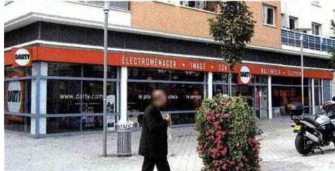
Les SCPI qui affichent depuis vingt ans des rendements supérieurs à 5 % font plus que jamais figure de valeur refuge.

Pour les particuliers qui ne souhaitent pas prendre le risque d'un investissement dans l'immobilier commercial « en direct », il est possible d'acheter des parts de Sociétés collectives de placement immobilier (SCPI) « murs de commerce », qui gèrent des centaines de boutiques. Les conditions fiscales y sont identiques, mais les montants d'acquisition beaucoup plus faibles, bien qu'il existe pour chaque société des minimas de souscriptions. Contrepartie de la mutualisation du risque permise par les SCPI, il faudra compter 1 à 1,5 point de rendement en moins que pour un achat en direct (voir tableau). Malgré cette contrainte, l'attrait des investisseurs pour la pierre papier se confirme, et les SCPI murs de commerce ont enregistré une collecte record de 512 millions en 2010 (+ 225 % par rapport à 2009), dans le sillage des bonnes performances réalisées par